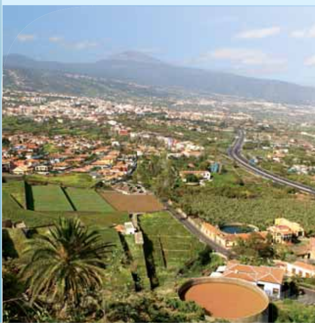
Porcentaje de isla